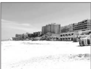
El propósito es evitar su privatización por parte de hoteleros.

La iniciativa es encabezada por la Secretaría de Desarrollo Agrario, Territorial y Urbano (Sedatu), en coordinación con la Secretaría de Medio Ambiente y Recursos Naturales (Semarnat) y el ayuntamiento de Solidaridad, municipio ubicado en la zona norte del estado, entre Cancún y Tulum. (EL UNIVERSAL)