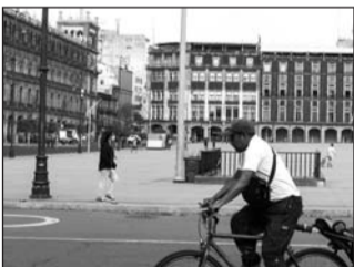
El Zócalo de la Ciudad de México es una de las opciones.

Confirmó que es un reto porque serían 628 legisladores, entre los 500 diputados y los 128 senadores, quienes tendrían que guardar la sana distancia. Por ello se analiza utilizar el Auditorio Nacional o habilitar una carpa en el Zócalo capitalino. (EL UNIVERSAL)