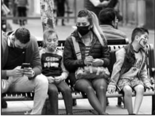
Continúa la difusión de medidas sanitarias esenciales.

La Secretaría de Salud del Estado de México reportó que 31 mil 699 mexiquenses han recibido su alta sanitaria tras haber padecido la enfermedad. (EL UNIVERSAL)