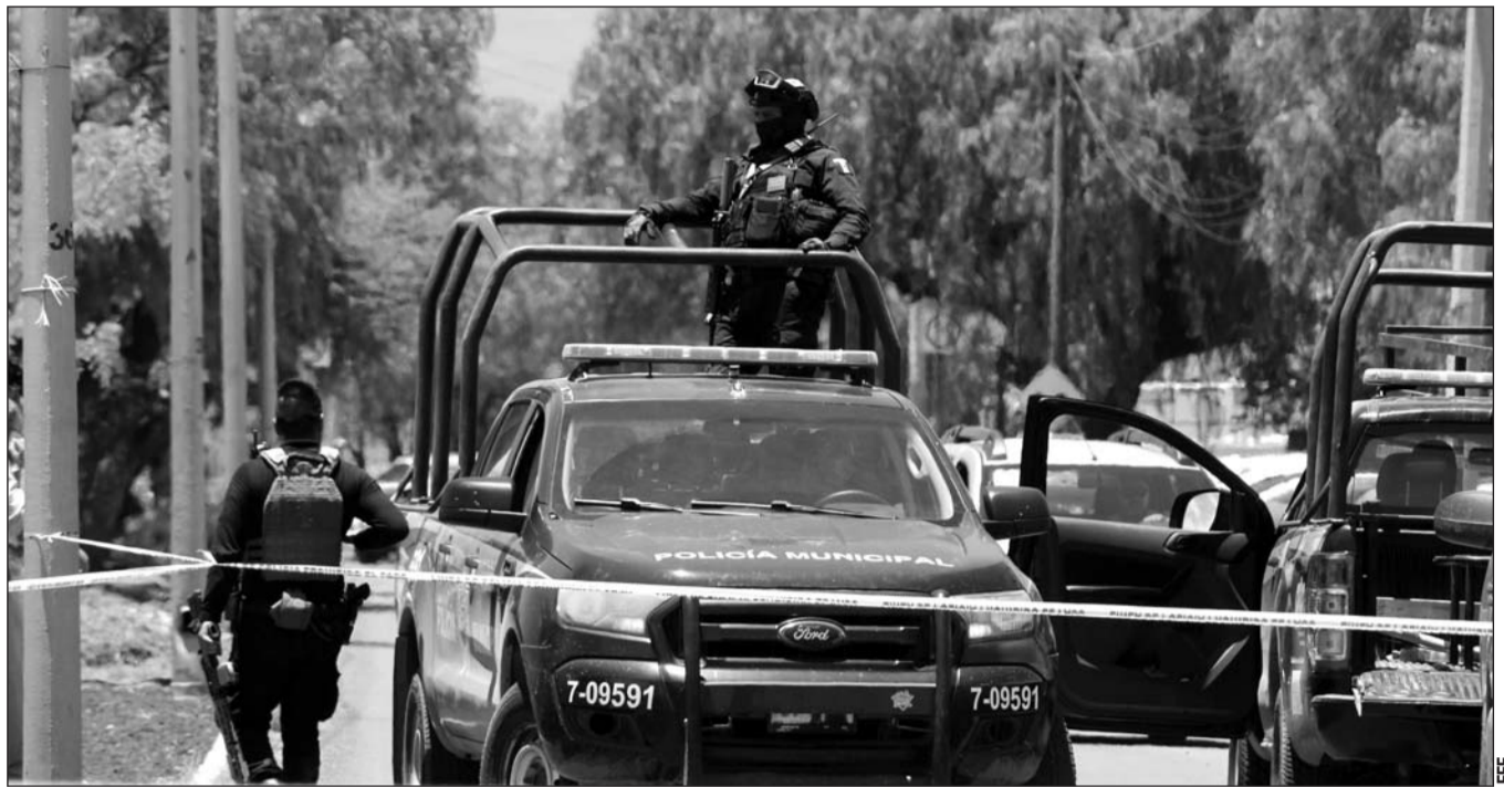
Resultados. El estado de Guanajuato se ha convertido en el más violento de México desde el 2018. Durante este año, de enero a junio, dos mil 293 personas fueron asesinadas, lo que representa el 13 por ciento de las víctimas del país.