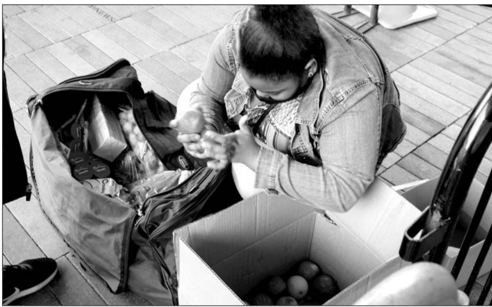
Respaldo. La ayuda económica es para personas que se quedaron sin trabajo.

Este domingo se celebrará una teleconferencia de donantes para el Líbano, auspiciada por el presidente francés, Emmanuel Macron, y en la que Trump tiene previsto participar.