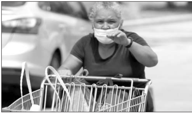
Rubro. El incremento es explicado en su mayoría por el alza de precio en algunos alimentos.