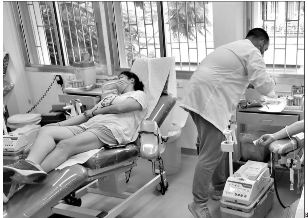
Aspecto. Insumos médicos es parte de lo que ofrecerá Estados Unidos al Líbano, luego de la explosión que sacudió a Beirut este martes.

"Nos unimos a otros en el llamamiento para una investigación completa y transparente sobre la causa de la explosión. El pueblo libanés se merece una rendi-