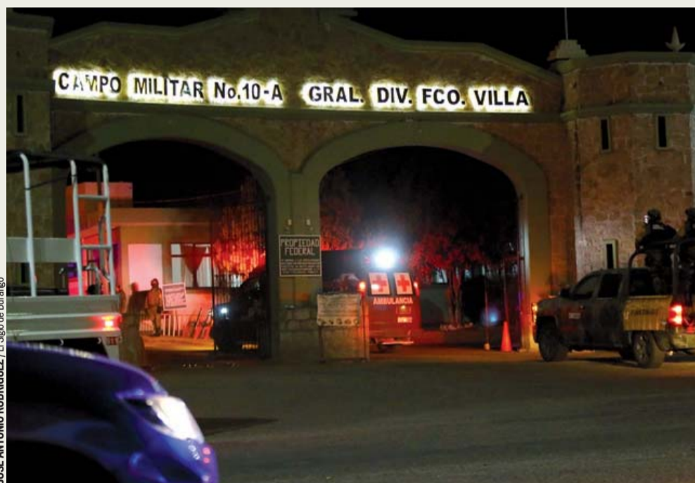
Un amplio dispositivo se desplegó por parte de elementos del Ejército Mexicano y la Guardia Nacional para trasladar las vacunas desde el Aeropuerto Internacional General Guadalupe Victoria a las instalaciones del Campo Militar del poblado 5 de Mayo, en la ciudad de Durango.