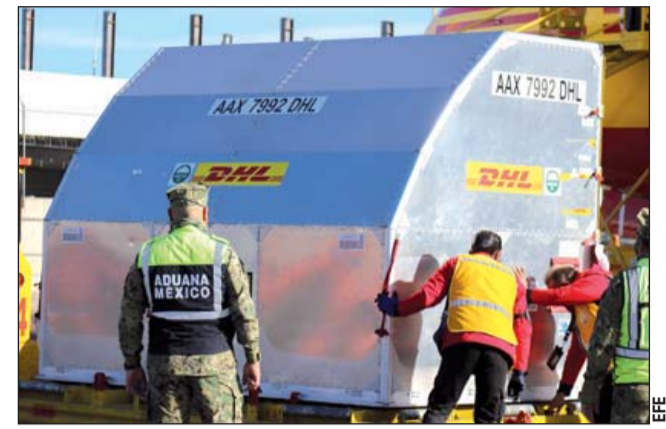
Sector. Se espera que de enero a abril se aplique la vacuna contra Covid-19 a 15 millones de adultos mayores.

Latina y no hemos olvidado al resto de América Latina porque México es solidario y estamos viendo que se acelera el proceso de la vacuna AstraZeneca, que será para todos los países de América Latina 250 millones de dosis”, dijo.