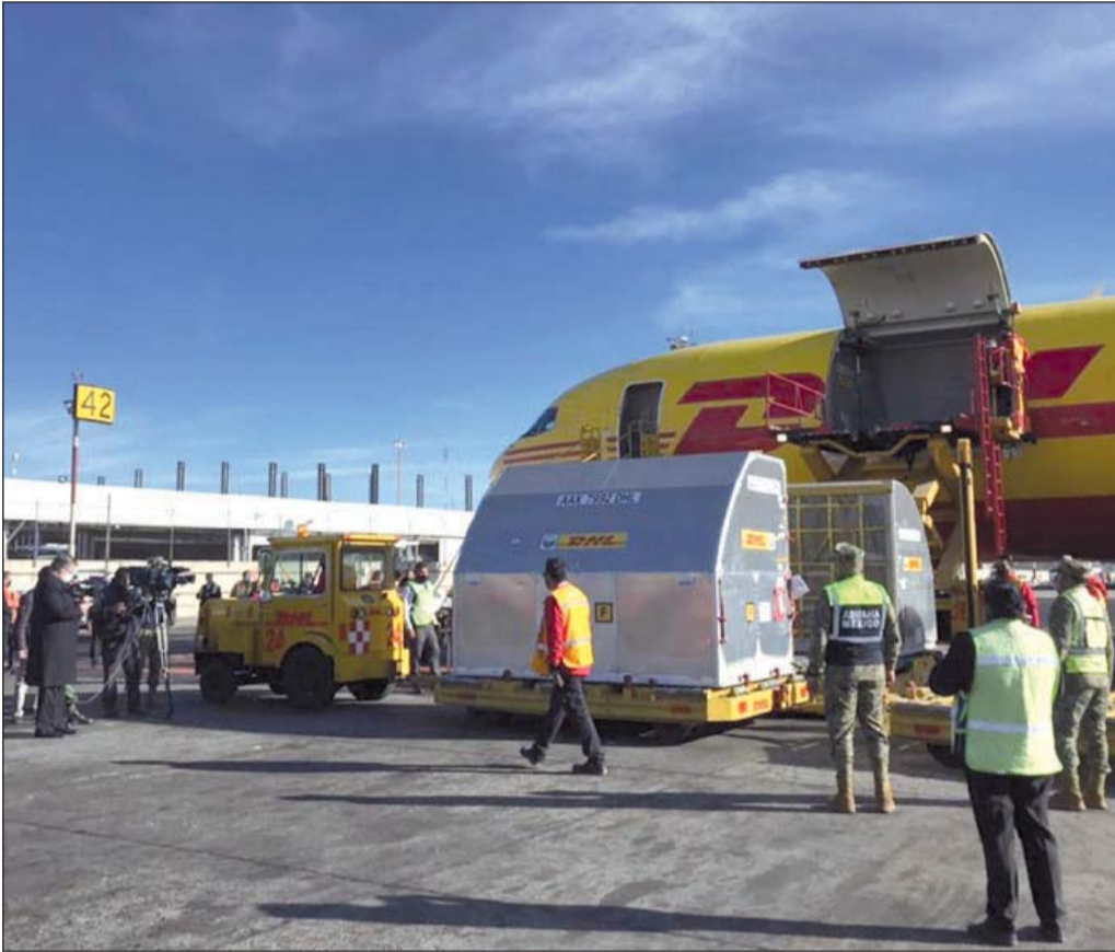
Obligación. El Secretario de Salud dio a conocer que este mes llegarán un millón 400 mil dosis, las cuales serán suficientes para vacunar a todo el personal médico en la primera línea de batalla contra el coronavirus en las 32 entidades del país.

“México es uno de los países de América Latina que más está vacunando. Con el millón 400 mil dosis de vacunas que recibiremos este mes, pensamos terminar de vacunar a los 750 mil trabajadores de la salud que están salvando vidas en los hospitales Covid públicos y privados”, dijo el funcio-