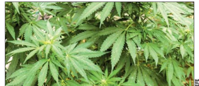
Avance. Con lo anterior se daría paso a que la industria en la materia pueda operar de manera legal.

Entre los pacientes estudiados se tienen 1 millón 556 mil 028 que tuvieron un positivo a la infección viral, 1 millón 949 mil 790 con un resultado negativo y 412 mil 576 que se mantienen como casos sospechosos.