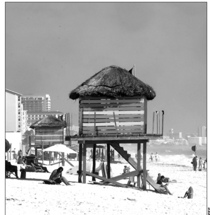
Lapso. Decenas de miles de estadounidenses vinieron a las playas sobre el Caribe a fines del 2020 y comienzos del 2021.

Existe el temor de que este repunte sea algo temporal ya que las infecciones del Covid-19 van en aumento tanto en México como en Estados Unidos, la principal fuente de turistas extranjeros. En ambos países se registran nuevos récords y en Estados Unidos ya se detectó una nue-