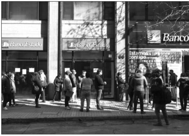
Cálculo. El alza en las estimaciones va en la línea de lo anticipado por el propio Banco Central, que en diciembre también mejoró sus proyecciones del PIB.