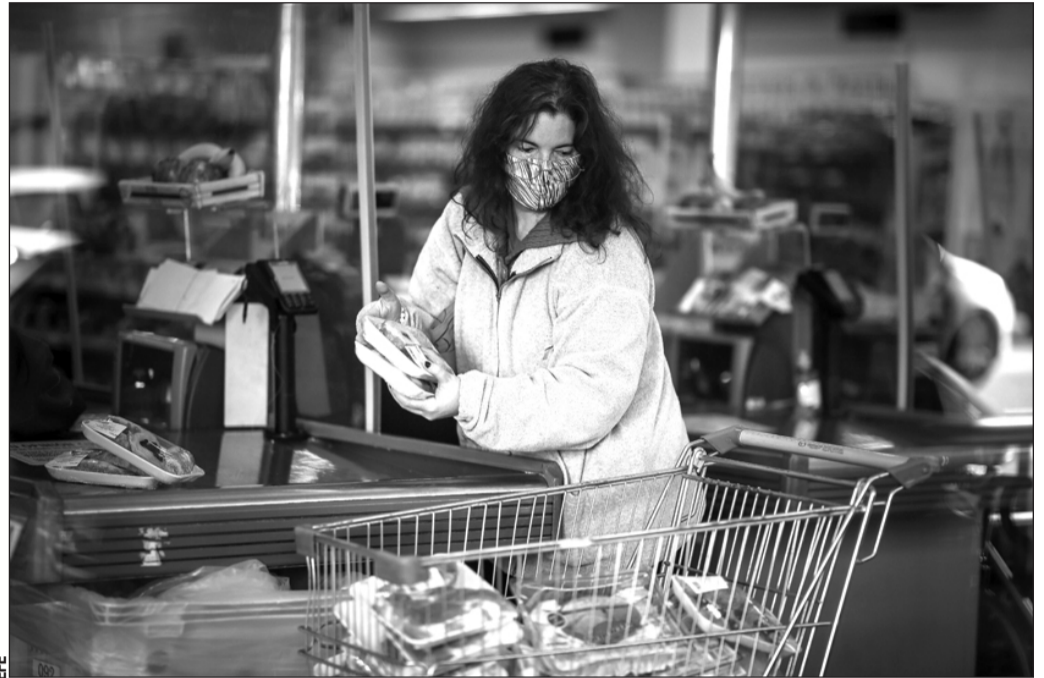
Antecedente. Fruto de un acuerdo voluntario entre el Estado, fabricantes, distribuidores, supermercados y mayoristas, el programa surgió en 2013 a iniciativa del Gobierno de Cristina Fernández (2007-2015), actual vicepresidenta.