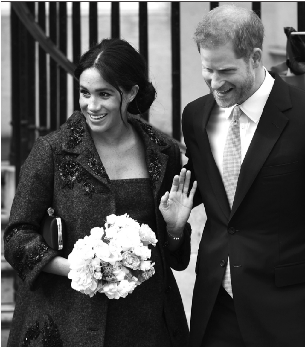
Proyectos. Además de su colaboración con Netflix, el príncipe Enrique y Meghan también han probado suerte en la radio con el podcast Archewell en Spotify, actividades muy lejos de la monarquía.

El príncipe Enrique será productor ejecutivo de “Heart of Invictus” y también aparecerá en pantalla en un rol todavía por determinar en este primer proyecto para Netflix de Archewell Productions.