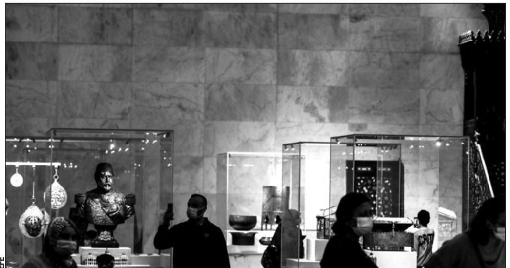
Suspensión. Se plantea incluso la posibilidad de no emitirla como estaba previsto durante el próximo Ramadán, el mes sagrado para los musulmanes, que comienza la semana que viene.

Cuando en los últimos días se comenzó a difundir el video promocional con el avance de la serie, empezaron a llover las críticas en las redes sociales y por parte de expertos en egiptología,