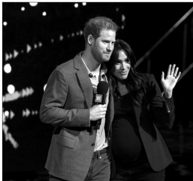
Los duques de Sussex fueron los protagonistas de una gran polémica cuando Meghan acusó a la Casa Real británica de racismo.

“Desde el momento en que los conocí, me quedó claro que los Juegos Invictus tienen un lugar muy especial en sus corazones y yo no podría estar más feliz al ver que su primera serie para Netflix mostrará eso al mundo de una manera que nunca se ha visto antes”, agregó.