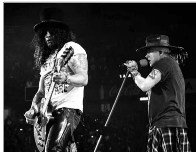
Motivo. El cambio del recorrido por Europa es un nuevo aplazamiento por el coronavirus de los conciertos del año pasado.

Las taquillas para los conciertos nuevos abrirán a partir de este 9 de abril, mientras que las entradas adquiridas previamente para las actuaciones reprogramadas seguirán siendo válidas.