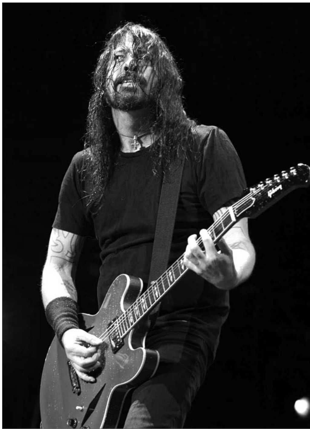
Contenido. Titulado “The Storyteller: Tales Of Life And Music”, saldrá a la venta en octubre de este año, y en él, Dave Grohl repasa sus propias experiencias, tan con Nirvana, Scream y Foo Fighters.

“Desde salir a la carretera con Scream con 17 años hasta mi tiempo con Nirvana o Foo Fighters. Zapar con Iggy Pop, tocar en los Grammy o bailar con AC/DC. Tocar la batería para Tom Petty o conocer a Paul McCartney en el Royal Albert Hall. Compartir cuentos para dormir con Joan Jett y contar la vez que conocí a Little Richard. La lista de anécdotas no tiene fin”, dice el exintegrante de Nirvana.