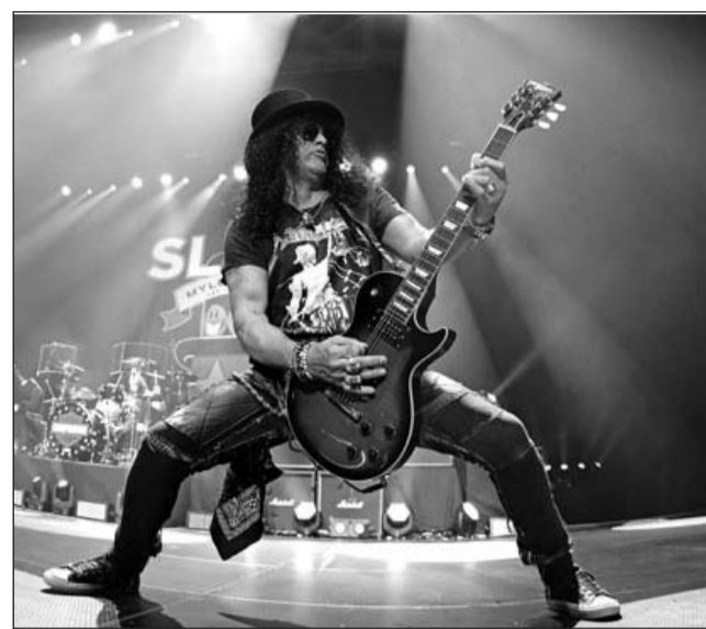
Inicio. El “tour” arrancará el 4 de junio de 2022 en Lisboa y concluirá en Múnich el próximo 8 de julio, en Olympiastadion.

“The Storyteller: Tales Of Life And Music” se estrenará el 5 de octubre y ya se puede comprar por anticipado.