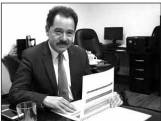
Mier planteó la posibilidad de platicar con Arturo Zaldívar.

“Vamos a ser responsables en este tema”, concluyó su mensaje en la red social. (EL UNIVERSAL)