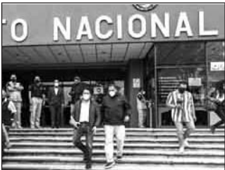
López Obrador descartó la desaparición del INE.

El presidente Andrés Manuel López Obrador aseguró que está en contra de la desaparición del Instituto Nacional Electoral (INE), pero consideró que se requiere que el organismo cuente con consejeros sean personas íntegras y honestas, pues acusó que los actuales, desde 2006, “la traen contra nosotros”. En conferencia de prensa, el titular del Ejecutivo federal señaló que, desde el 2006, los consejeros le tienen “fobia”. “Descartada la desaparición del INE porque se requiere un organismo para la organización de las elecciones, eso es imprescindible, cualquier país del mundo, lo que hay que buscar es que sea un organismo profesional”. (EL UNIVERSAL)