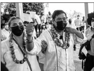
Félix Salgado busca que se le devuelva la candidatura.

El magistrado, también guerrerense, tendrá la responsabilidad de elaborar el proyecto que será planteado a la Sala Superior del TEPJF para que se resuelva en definitiva el caso de Salgado Macedonio, quien argumenta que la decisión adoptada por el Consejo General del Instituto Nacional Electoral (INE) en contra de su registro como candidato es injusta y desproporcionada. (EL UNIVERSAL)