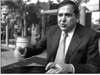
Deberá erogar 216 millones de dólares.

La defensa de Ancira, antiguo dueño de Altos Hornos de México (AHMSA) informó que realizará tres pagos anuales a partir del 30 de noviembre próximo para que la FGR no lo lleve a juicio por lavado de dinero por estar acusado de vender una planta chatarra de fertilizantes a Pemex en 2013. (EFE)