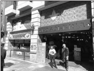
Sólo en aspectos muy específicos se permitirá el “outsourcing”.

El dictamen aprobado, que reforma la Ley Federal del Trabajo, la Ley del Seguro Social, la Ley del Infonavit, el Código Fiscal de la Federación, la Ley del Impuesto sobre la Renta y la Ley del Impuesto al Valor Agregado, establece que queda prohibida la subcontratación de personal, y solo se permite en servicios especializados. (EL UNIVERSAL)