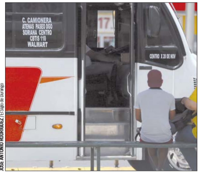
Sin fecha. No se ha definido una fecha precisa para la reunión en la que se determinará un posible incremento.

“Es verdaderamente complicado porque el sector si trabaja por debajo de sus costos de operación, cómo le podemos exigir que siga prestando el servicio, adicional a eso si en su momento solamente podía trasladar al 50 por ciento de su capacidad el autobús, pues imagínense, y con poca movilidad y todo lo que ya sabíamos que ocurrió por el confinamiento. No es una situación fácil para nadie”.