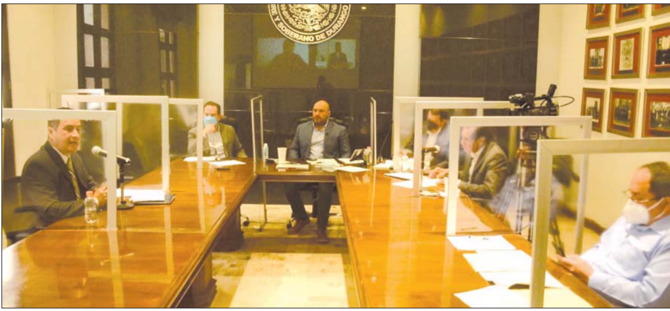
Apertura. El proceso de entrevistas se transmitió a través de la cuenta del Congreso del Estado en redes sociales para que la ciudadanía verificara sus participaciones.