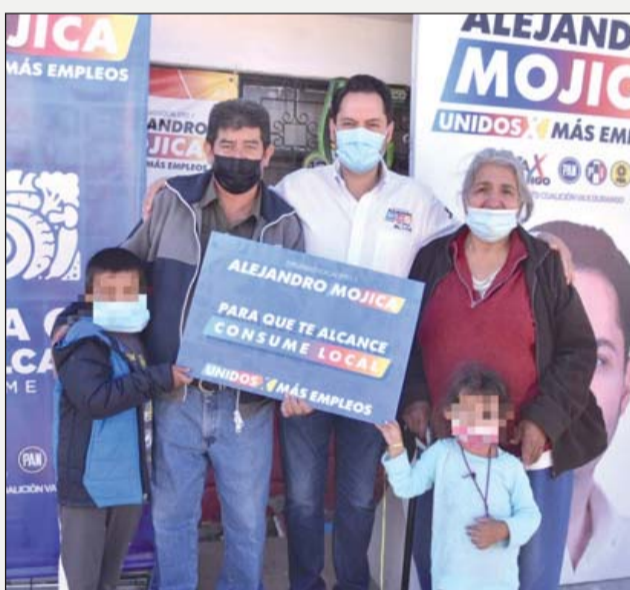
Compromiso. La creación de un fondo para la protección del ingreso familiar y el impulso al comercio local.

Dijo que, en estos días de campaña ha visto la angustia y desesperación de muchas familias que forman parte de los 38 mil 500 duranguenses que se encuentran sin empleo y de los casi 159 mil que trabajan por su cuenta y que ven como el dinero no les