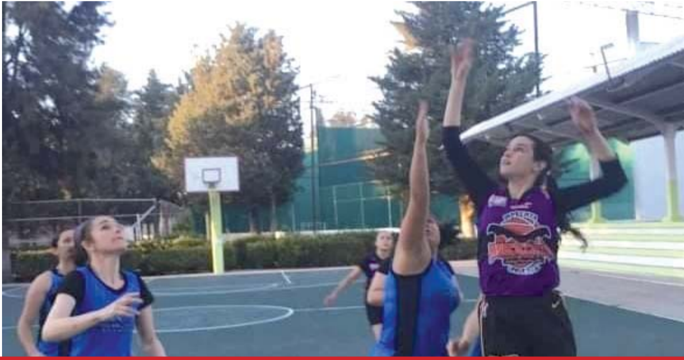
RAFFA GONZÁLEZ / El Siglo de Durango

Las categorías varoniles se enfrascaron en una cerrada competencia.