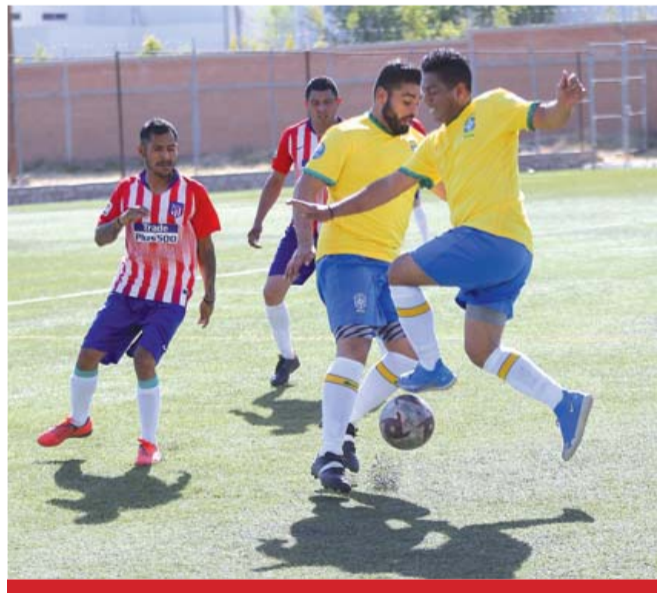
Líder. El equipo de Pachuca Romero continúa en la cima de la categoría Premier de la Liga Durango de Veteranos.

timas jornadas Pachuca sigue de líder con 24 puntos, los cuales son producto de