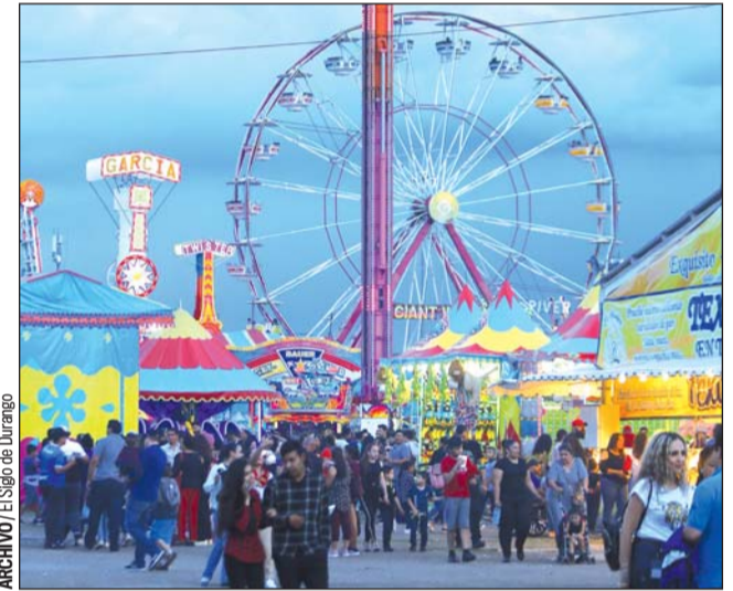
Incertidumbre. El Secretario enfatizó que no hay buenos o malos sino que todo cambia conforme a las circunstancias.

Y reiteró que se deben revisar primero las especificaciones legales del decreto.