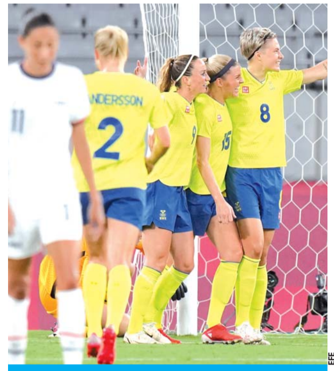
Sorpres. Las suecas sorprendieron a Estados Unidos con una victoria 3-0 al arrancar el torneo de fútbol femenino.

■ Gran Bretaña, Chile, Estados Unidos, Suecia, y Nueva Zelanda hincaron la rodilla.