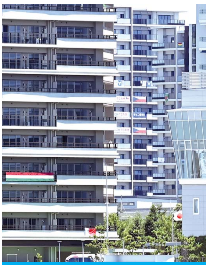
Renuncia. Guinea renunció a participar en Tokio 2020.

Hasta la tarde de este miércoles, cerca de 90 personas relacionadas a los XXXII