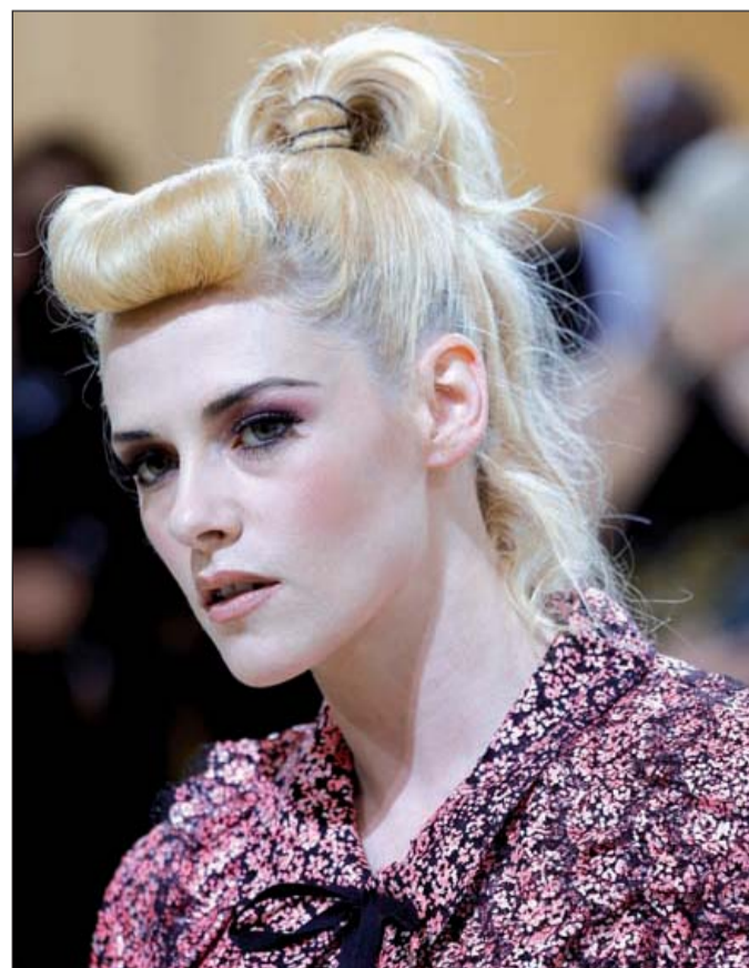
Los peinados altos y voluminosos, como este tipo de colas de caballo que vimos en la Met Gala, prometen tomar las tendencias de los meses que quedan del año.