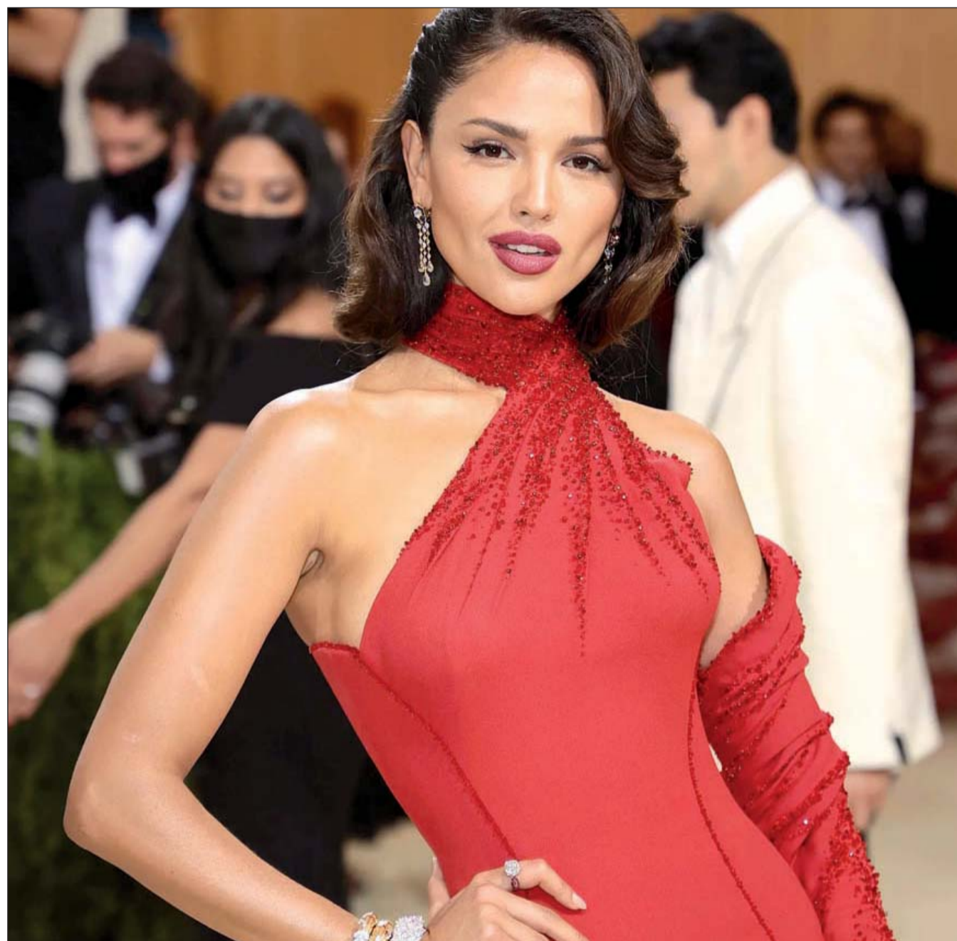
La mexicana Eiza González en su estilo muy al estilo María Félix.

La noche más esperada por las celebridades.