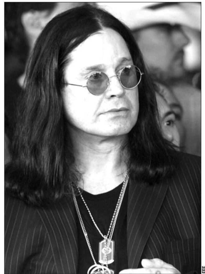
Tema. La mezcla musical une las voces del “Príncipe de las tinieblas” y del líder de Motörhead en el sencillo de 1991.

El artista ha conseguido hasta la fecha 31 números 1 en Latin Airplay, la mayor cantidad de la historia.