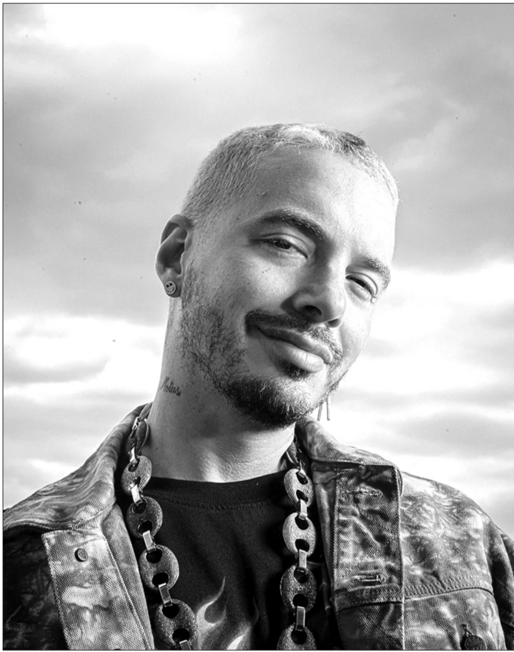
Recorrido. El músico colombiano visitará San Francisco, Las Vegas, Tucson, Portland, Miami, Charlotte, Nueva York, Houston, Dallas, Atlanta y Washington DC, además de Montreal y Toronto.

El nuevo álbum “Jose” constituye el esfuerzo más