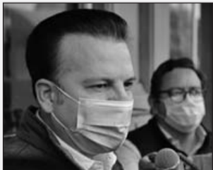
Gestión. Diputados Federales tienen oportunidad única para entregar buenas cuentas, afirmó.

“Entre todos hay que seguir insistiendo en que la Federación absorba el gasto educativo en nuestro presupuesto, sin recortar ese recurso de nuestro presupuesto, que asciende a al-