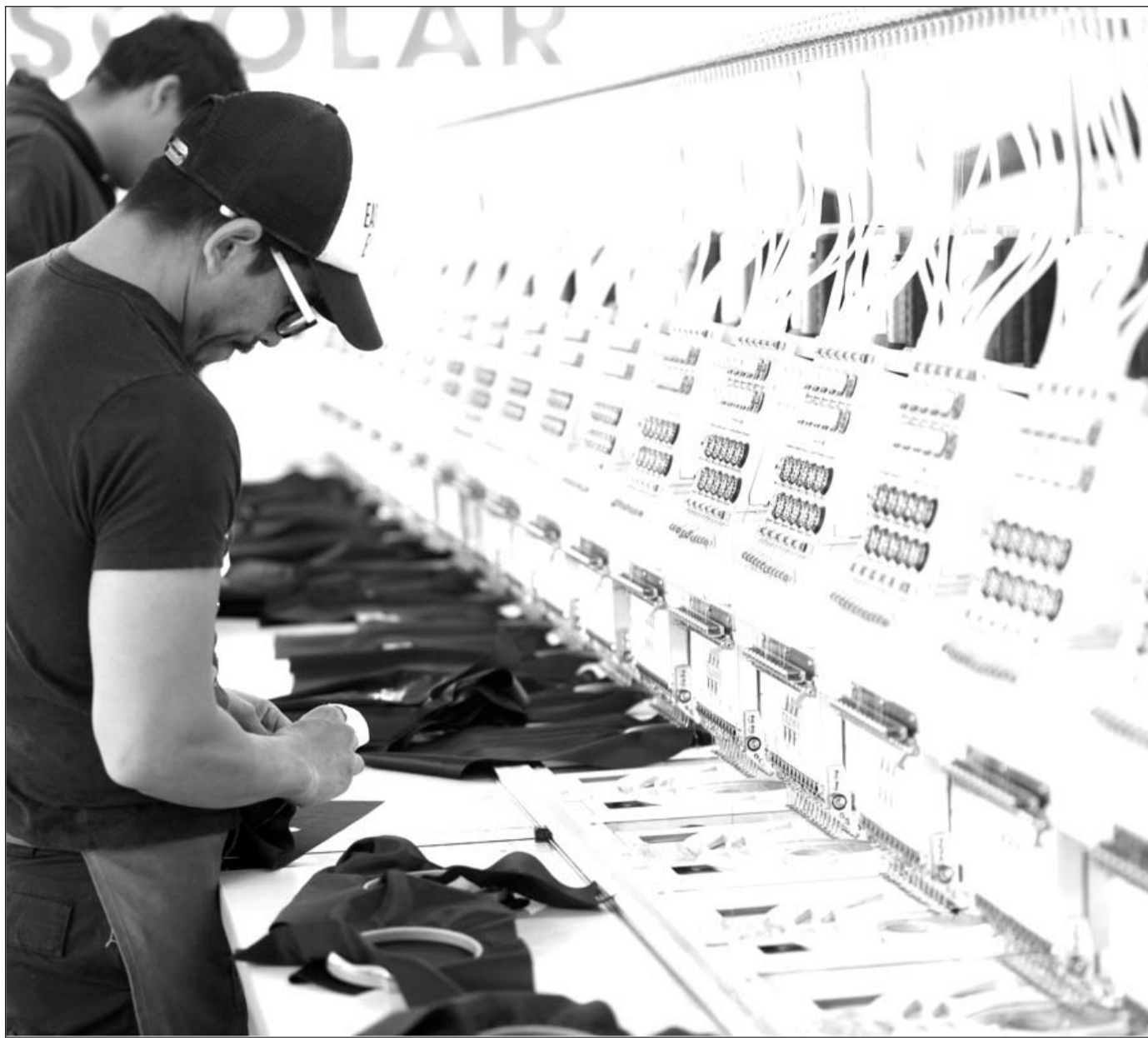
Fabricación. Participan en la elaboración de los uniformes talleres locales que son contemplados cada año en la licitación y que generan empleos.