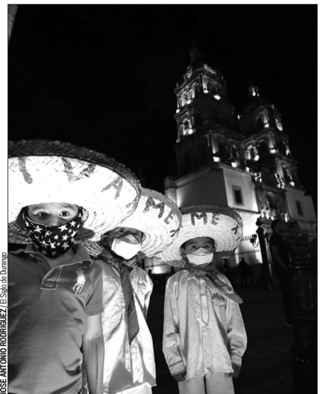
Optimismo. Se prevé que durante el último trimestre del año las ventas se incrementen.

“Eso sería un éxito total para un cierre de año benéfico”, dijo el Presidente de la Canirac.