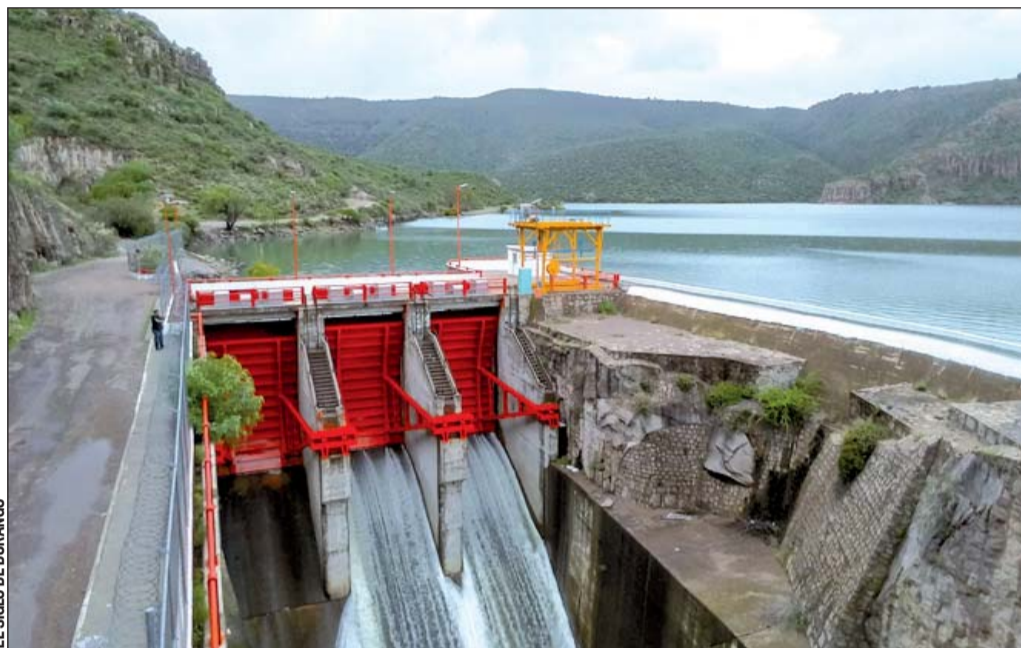
EL SIGLO DE DURANGO

Asimismo, estableció que se hará un monitoreo constante de la Presa del Hielo, "que no es una presa