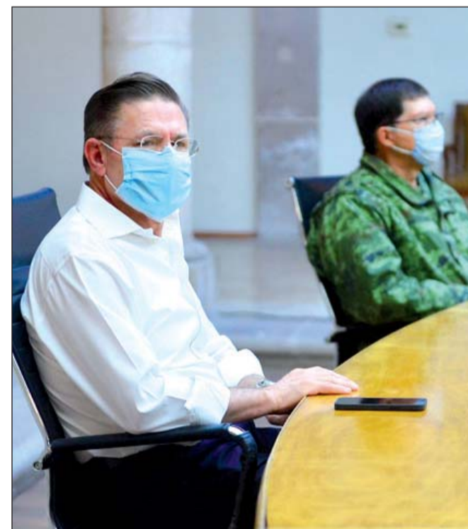
Consejo Estatal de Protección Civil en sesión permanente.

El Consejo Estatal de Protección Civil, integrado por dependencias y organismos de los tres órdenes de Gobierno, se reunió de manera extraordinaria desde la noche de lunes, para coordinar esfuerzos de prevención y reacción por este fenómeno meteorológico.