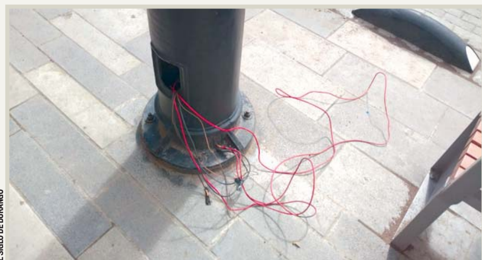
EL SIGLO DE DURANGO