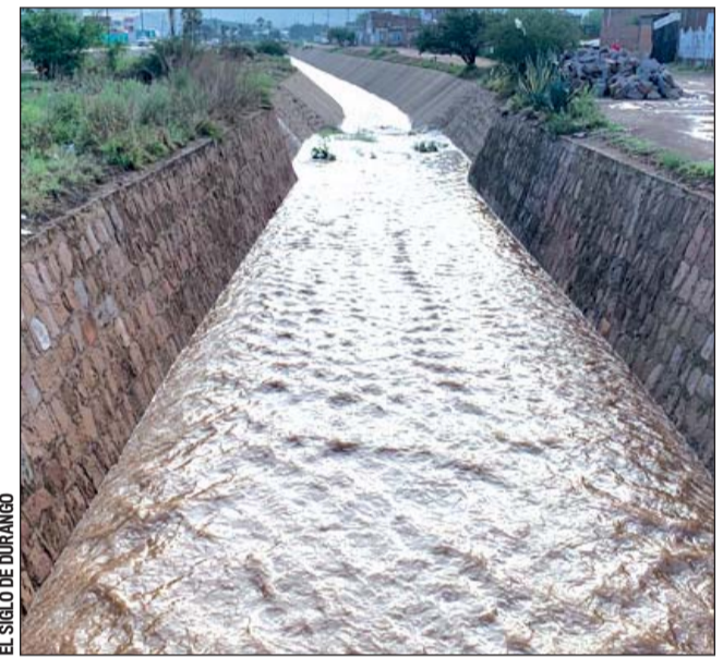
Precaución. Protección Civil Municipal exhorta a extremar precauciones con la llegada del huracán "Pamela".

Sin embargo, aunque ya es obligatorio, aún no adquieren un seguro todas las personas que manejan.