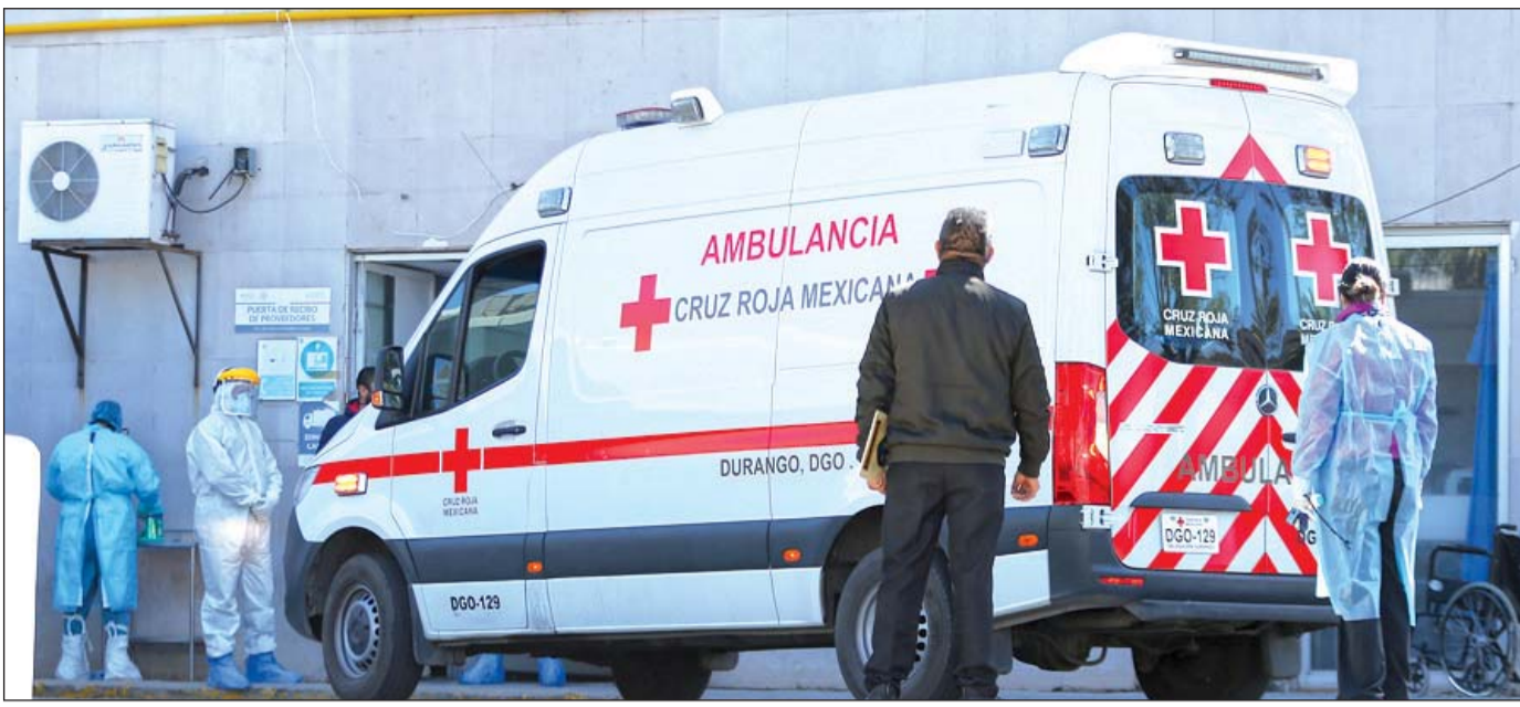
Costo. La mayoría de las familias de Durango no están en condiciones económicas de afrontar una emergencia como la que implica un paciente gravemente enfermo de Covid-19.