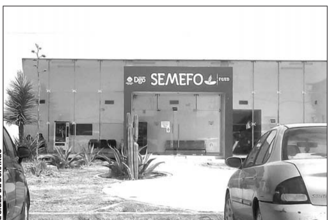
Dolor. En el municipio de Lerdo se registró el suicidio de un joven de 29 años de edad.

Los vehículos y personas mencionados fueron puestos a disposición del Ministerio Público para que se realicen las investigaciones correspondientes y se proceda en consecuencia.