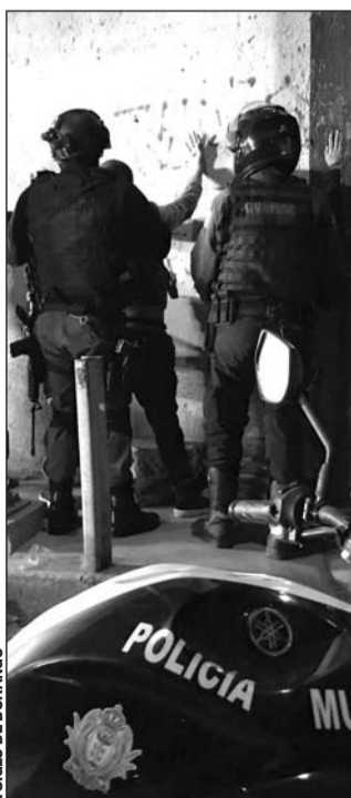
Esfuerzo. Los uniformados municipales tuvieron una semana llena de actividad.

Por parte de la Dirección de Prevención y Atención a la Violencia Familiar y de Género brindaron 127 auxilios