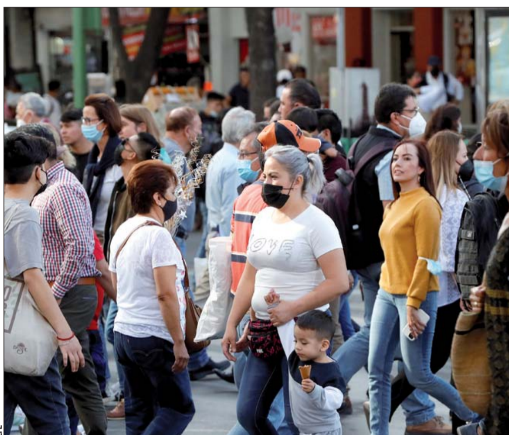
Cifras. El país suma 17 semanas consecutivas de descenso en los contagios tras una tercera ola que alcanzó su pico entre julio y agosto. López-Gatell, presumió de una "reducción cuantiosa".

El martes, el estratega del Gobierno contra la pandemia, Hugo López-Gatell, presumió de una "reducción cuantiosa" y "sostenida" de los casos de Covid-19