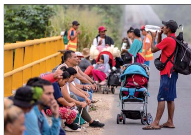
Camino. El contingente, conformado por varios centenares de personas y en ruta desde hace un mes, avanzó muy disperso.