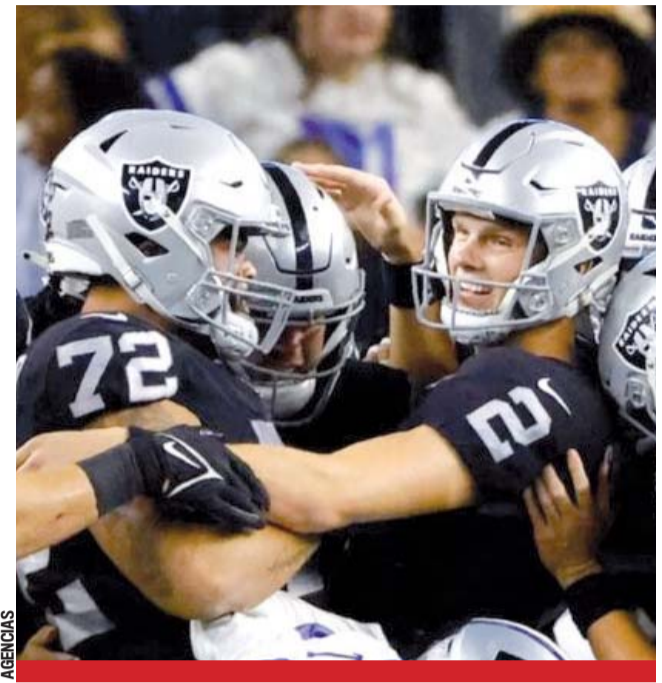
Racha. El equipo de Las Vegas se impuso a 36-33 a un equipo texano que sigue en mala racha.