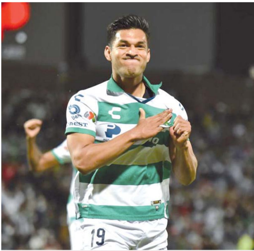
Triunfo. Los Guerreros de la Comarca metieron dos goles en 11 minutos y así enfilaron el triunfo, aunque Gignac le dio mucha vida a los de la UANL casi al final.

Los visitantes se adelantaron en el mejor momento de los locales. Al 29, en un tiro de esquina por izquierda cobrado por el ecuatoriano Ángel Mena la pelota le rebotó en el pecho al defensa