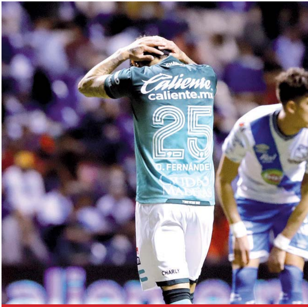
Remontada. Puebla remontó para derrotar el jueves 2-1 a León en el choque de ida por su serie de cuartos de final del torneo Apertura mexicano.