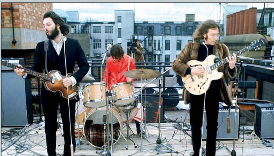
Bajo la dirección de Peter Jackson, esta producción muestra el detrás de su famoso show en la azotea.