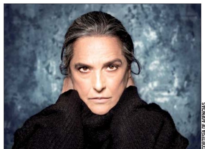
Producción. Luego de su grabación en Argentina, el disco permaneció en espera por más de dos años luego de la actual pandemia.

Y es que 'El lado sur de mi corazón' incluye temas de éxito de Gustavo Cerati, Charlie García, Pedro Aznar, Luis Alberto Spinetta, Fito Páez, entre otros.