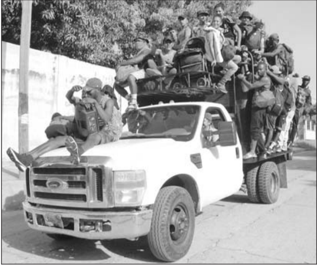
Trámite. Los haitianos ocupan el 70% de los trámites ante las autoridades migratorias y, en señal de protesta, se han manifestado en varias ocasiones, tensando todavía más la situación.