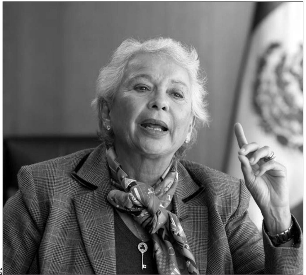
Debate. Surgió por una propuesta presentada por 52 senadores de oposición para que la presidenta de la Mesa Directiva, a nombre del Senado, presente una controversia constitucional, por considerar que el acuerdo publicado en el Diario Oficial de la Federación (DOF) el pasado 22 de noviembre.

“Nosotros sí creemos que hay un interés público para desarrollar estos proyectos estratégicos de infraestructura, de desarrollo socioeconómico y de turismo en la zona en donde se están realizando. Se requiere respaldar estas regiones. Es la infraestructura para el