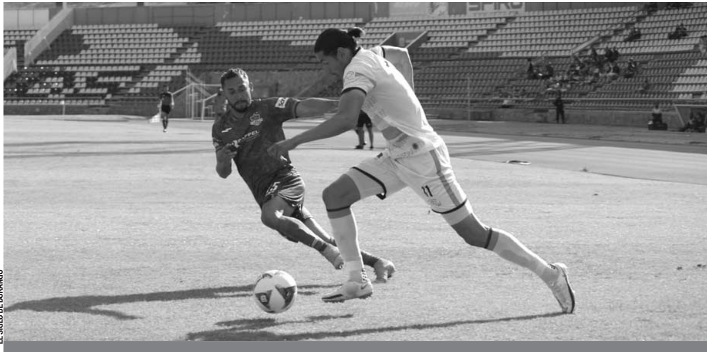
Cierre. Alacranes cierra esta noche la temporada regular ante los Correcaminos de la UAT.

■ A mitad de semana los venenosos estarán jugando la liguilla.