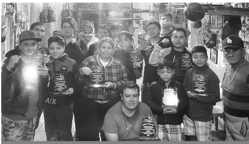
Aniversario. El Gimnasio "Paco Valenzuela" cumplió 12 años.

Agregó que han sido muchas las personas que se han acercado a "poner su granito de arena" como es el caso de