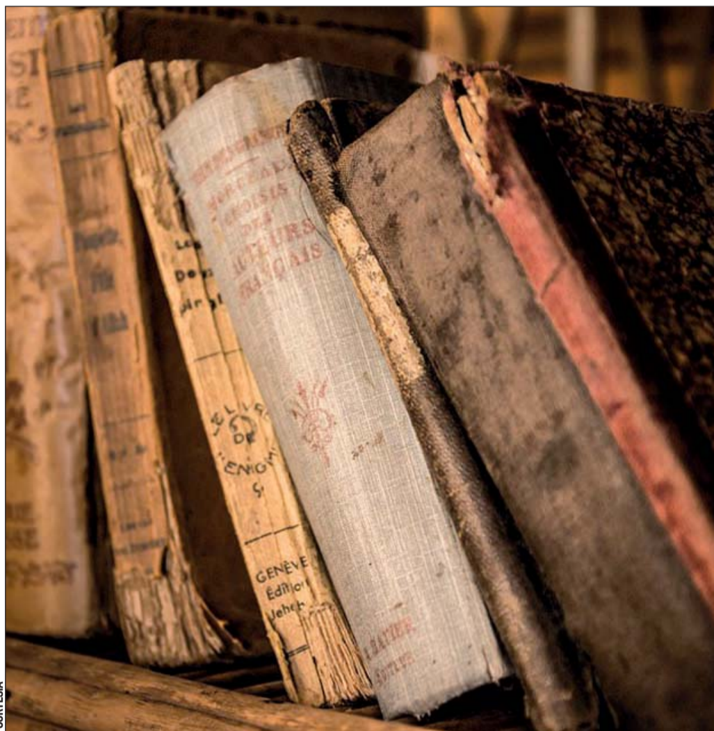
Objetivo. El encuentro busca visibilizar, desde una perspectiva de género, la labor de las editoras.

El encuentro enmarcado en el Día Internacional de la