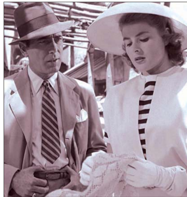
Trama. La cinta considerada una de las mejores de la cinematografía estadounidense, se sitúa en un periodo de posguerra.