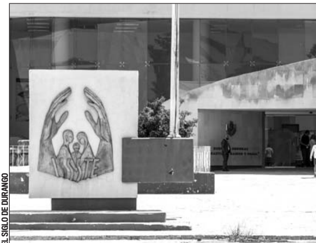
Disposición. Aseguró el Gobernador que existe disposición de colaborar con lo que determine el Gobierno Federal.

No todas las personas tienen un aguinaldo asegurado para esta Navidad, de hecho buena parte de la población en Durango trabaja en actividades informales lo que les impide acceder a prestaciones. De ahí que la solidaridad de los demás es necesaria para ellos.