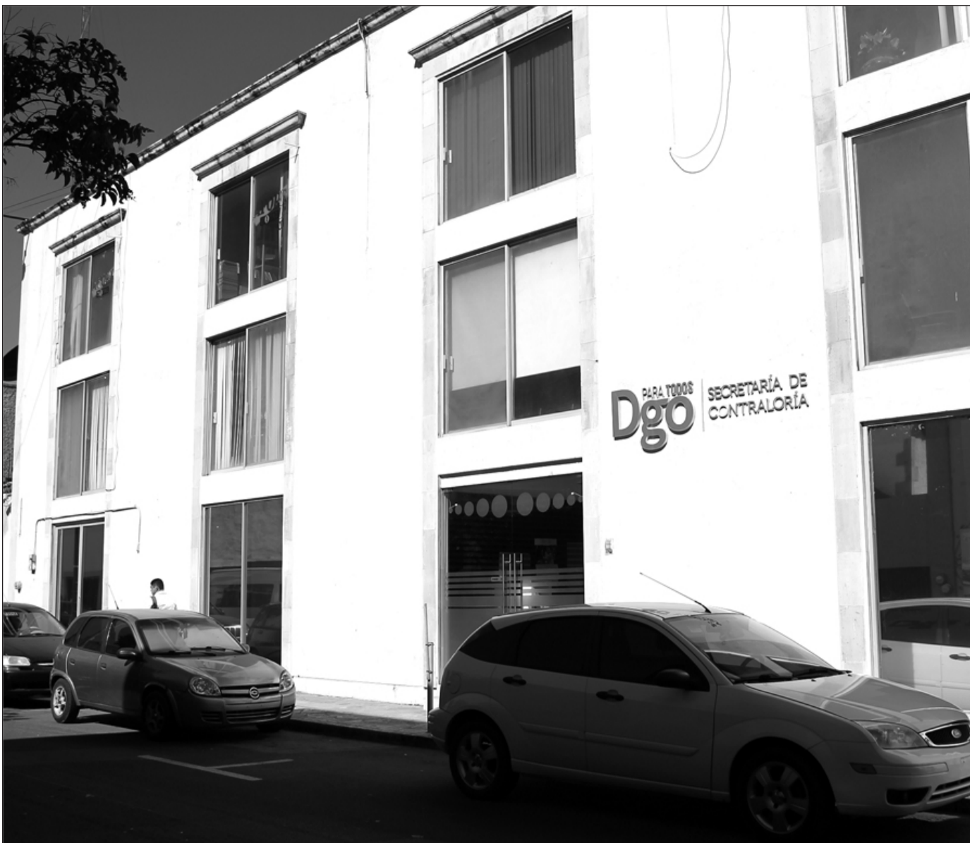
Sanciones. Amonestación pública, inhabilitación y multas son algunas de las sanciones que le compete aplicar a la Secretaría de la Contraloría; las faltas graves se turnan a otras instancias.