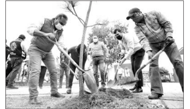
Trabajo. Alcalde entrega la rehabilitación de un multideportivo más, ahora en el fraccionamiento Fidel Velázquez II.