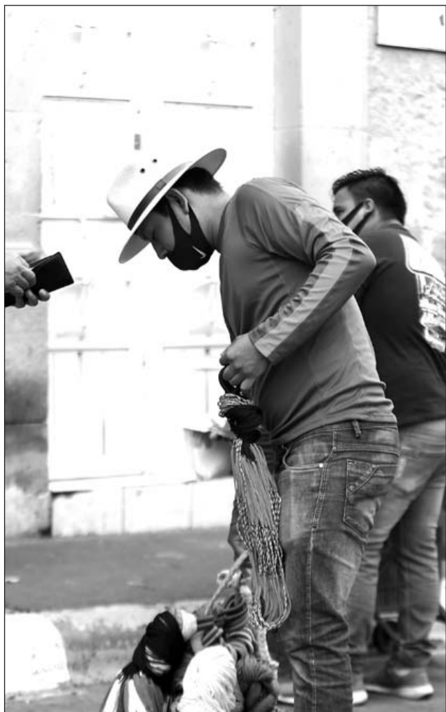
Atención. Pretenden mantener en orden la actividad comercial en el Centro de la ciudad.