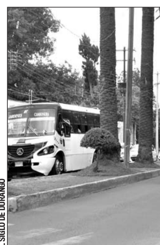
Temporada. Preocupa que en estas fechas se pueda incrementar la inseguridad en algunas zonas.

No obstante, ante la necesidad que tienen de trabajar, tienen que seguir adelante.