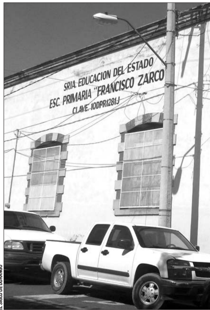
Cambio. Desde que se registró un derrumbe en el inmueble viejo, se cambiaron al excolegio Guadiana.

Señalaron que tras el derrumbe que se registró hace algunos años los cambiaron al excolegio Guadiana y les habían dicho que era de forma temporal y ahora ya ese inmueble se está usando para oficinas administrativas.