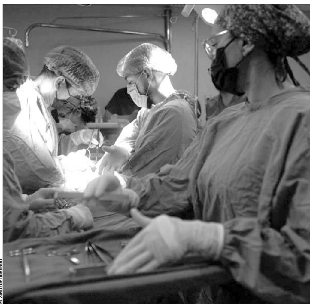
Donación. Después de 20 meses, se realiza la primera donación multiorgánica en el IMSS de Durango, en beneficio de cuatro familias.

Y este 1 de diciembre se realizó la primera donación multiorgánica en Durango después de 20 meses, se trata de una persona del sexo masculino de 69 años de edad con muerte cerebral donde los familiares decidieron donar sus riñones y