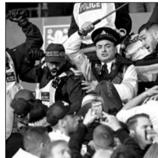
Drogas y alcohol pudieron haber llevado a un desastre mayor.