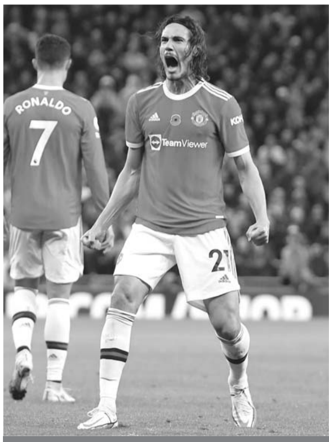
Lesión. Lleva fuera desde el 2 de noviembre con problemas de tendón. Se ha perdido los últimos compromisos internacionales con su selección.

Esta temporada, sin embargo, su participación ha bajado mucho. La llegada de Cristiano Ronaldo, más la vuelta de un Jesse Lingard que se pasó cedido medio año en el West Ham, le han cerrado aún más las puertas a Cavani. Apenas ha podido disputar ocho partidos, dos de ellos como titular, y solo ha hecho un gol, ante el Tottenham en la victoria por 0-3 de hace tres semanas.