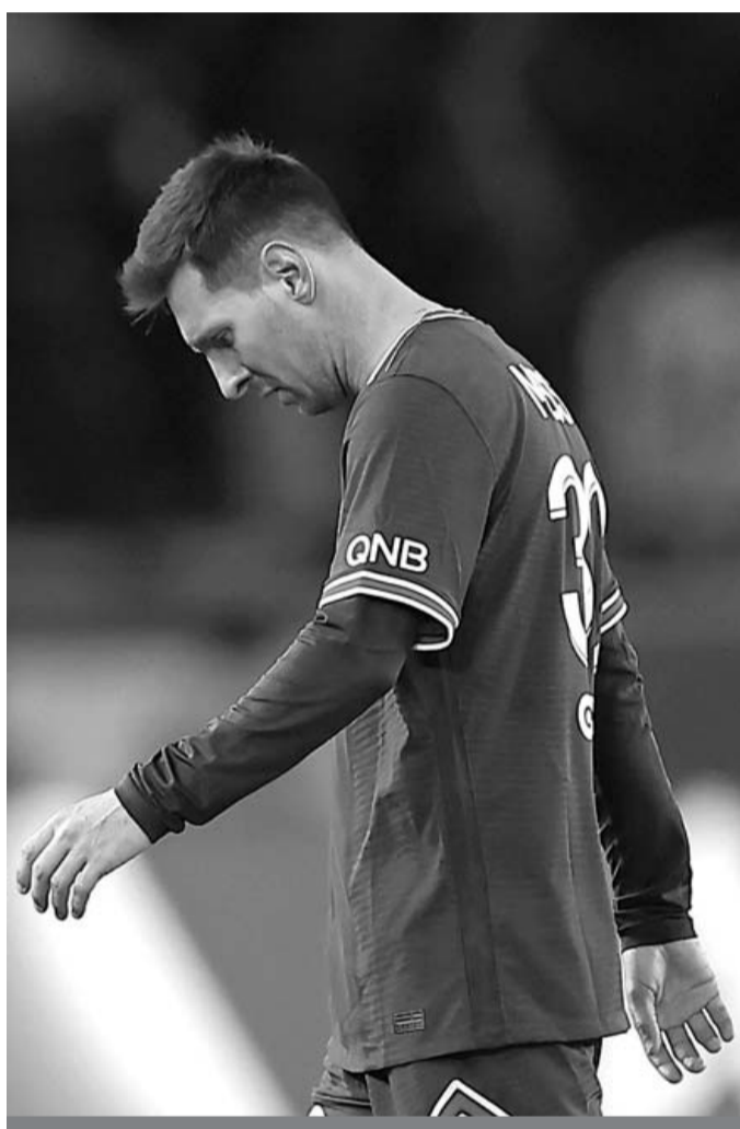
Juego. Messi golpea menos y, por lógica, marca mucho menos. El periodo de gracia de cien días acaba de superarse.

“Creamos ocasiones y es cierto que hemos tenido mala suerte. Pero Leo marcará goles, tiene un talento in-