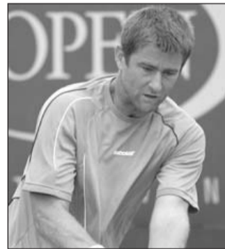
Alemania ganó 2-1 a Serbia y 2-1 a Austria en la fase de grupos.

Dijo que el equipo ruso “es tan fuerte que aunque se enfermaran dos jugadores, lo seguiría siendo”.