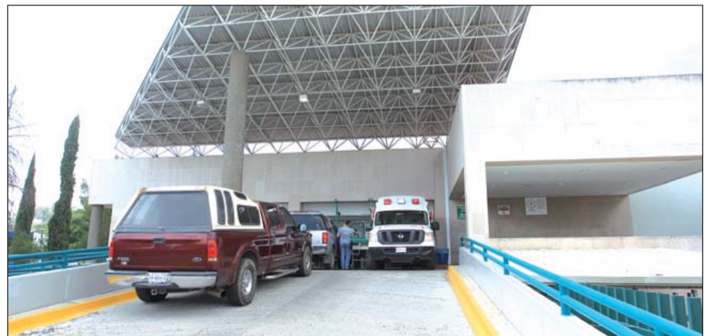
Urgencia. Un joven arreglaba su motocicleta cuando se arrancó un pedazo del dedo pulgar derecho con la cadena del vehículo.

Según las versiones del personal lesionado se encontraba arreglando su motocicleta cuando en cierto momento y por accidente