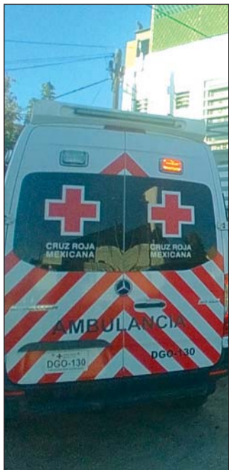
Dolor. Hombre que fue atropellado el 14 de noviembre, pierde la vida en el hospital.

En la madrugada de este viernes, a pesar de los esfuerzos de la ciencia médica,