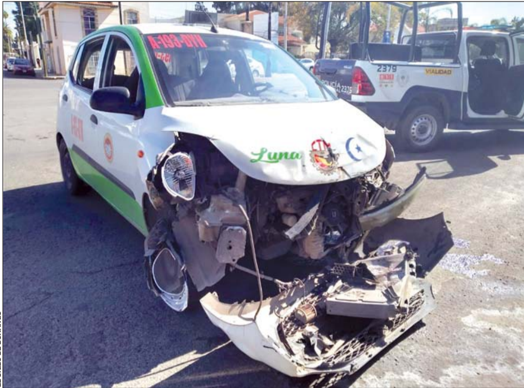
Daños. Un aparatoso choque se registró en bulevar Dolores del Río y calle Aquiles Serdán, en donde dos pasajeros de un taxi resultaron lesionados.

nal de la Cruz Roja Mexicana, quienes brindaron la atención prehospitalaria a los lesionados y valoraron a los dos conductores, quienes no presentaron complicaciones.