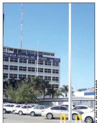
Caso. Varón se entregó a las autoridades tras presunto abuso.

Al ver su falta y la posible denuncia en su contra, el varón de 28 años, decidió entregarse a las autoridades. Al lugar acudieron uniformados municipales, quienes lo pusieron a disposición del Agente del Ministerio Público.