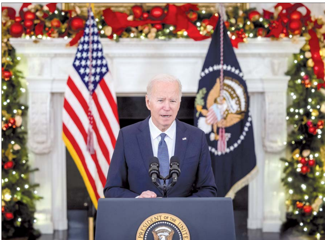
Acción. Joe Biden firmó una ley para evitar un cierre de la Administración solo horas antes de que se quedara sin fondos.