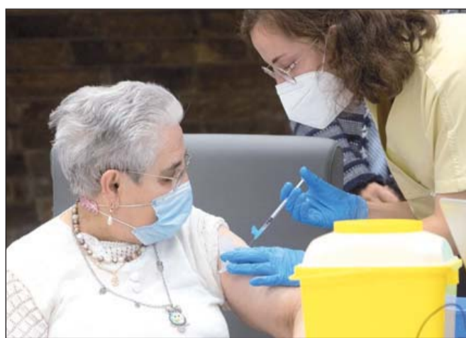
Fecha. En octubre, NACI había limitado el uso de dosis de refuerzo para los mayores de 80 años de edad.

En el informe dado a conocer este viernes, NACI señaló que reconoce que "la evidencia sobre las dosis de refuerzo de las vacunas de Covid-19 está evolucionando rápidamente" y que las simulaciones realizadas apuntan a que la tercera dosis reduciría "las infecciones y enfermedades graves", al menos a corto plazo.