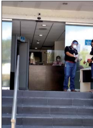
Receso. Se atenderán solo asuntos urgentes durante el receso de la mayor parte del personal.

En el Palacio de Justicia se encuentran las salas de audiencia de los delitos de tipo penal, desde control de la detención, órdenes de