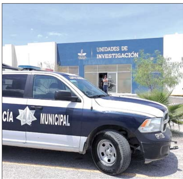
Casos. En noviembre se reportaron solo dos casos en la región Laguna de Durango.