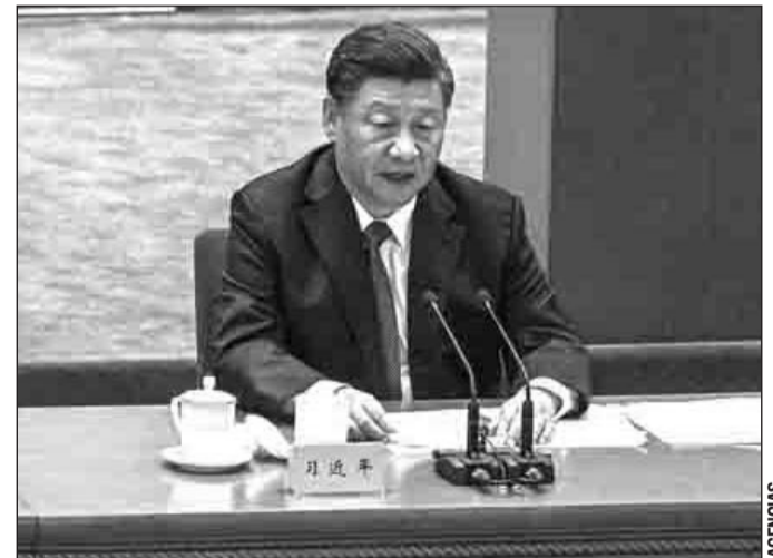
Partes. La reunión contó con la participación de los presidentes de los dos países anfitriones: Xi Jinping, en representación de China, y Andrés Manuel López Obrador, por parte de México.

La reunión, celebrada por videoconferencia, contó con la participación de los presidentes de los dos países anfitriones: Xi