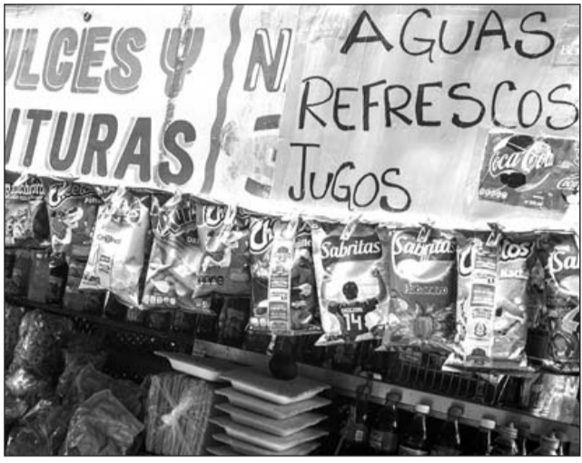
Sobresaliente. México es el mayor consumidor de alimentos procesados y ultra procesados en América Latina y el cuarto en el mundo.