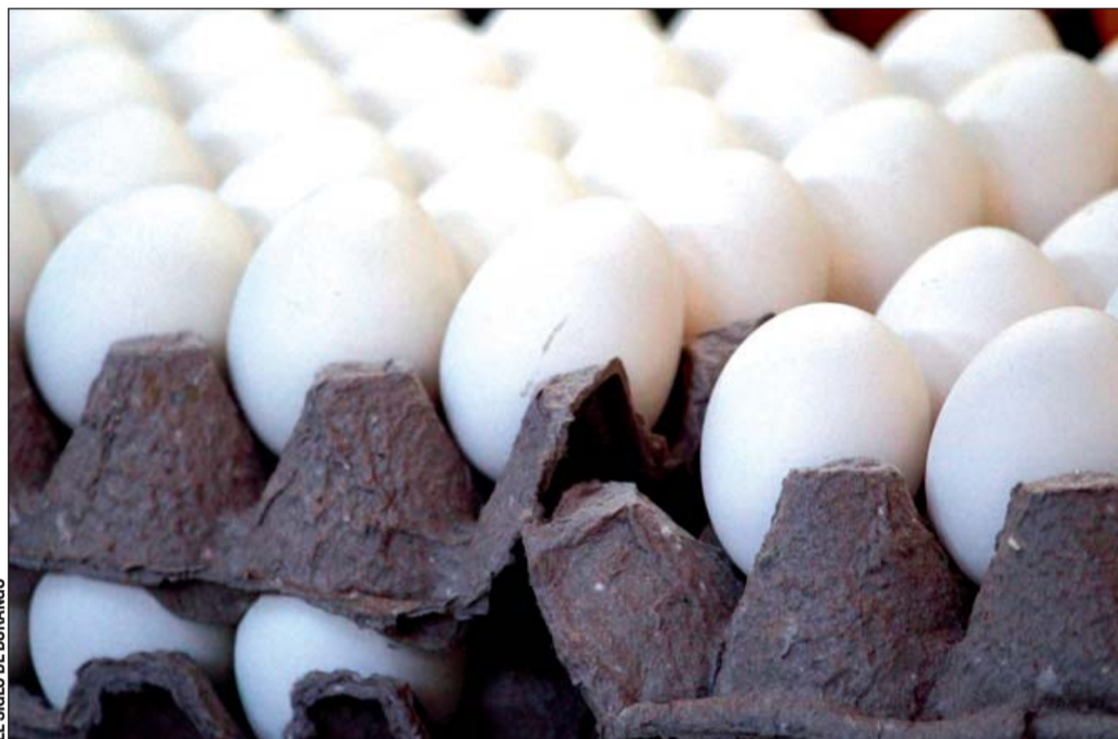
EL SIGLO DE DURANGO

Reiteró que se trabaja en coordinación con Senasica para garantizar la salud de la población, no solo de La Laguna, sino del estado en general. “Por eso hoy está en cuarentena el poder comercializar y sea los pollos o huevos a otros lugares, hasta en tanto no se terminen de revisar todas las