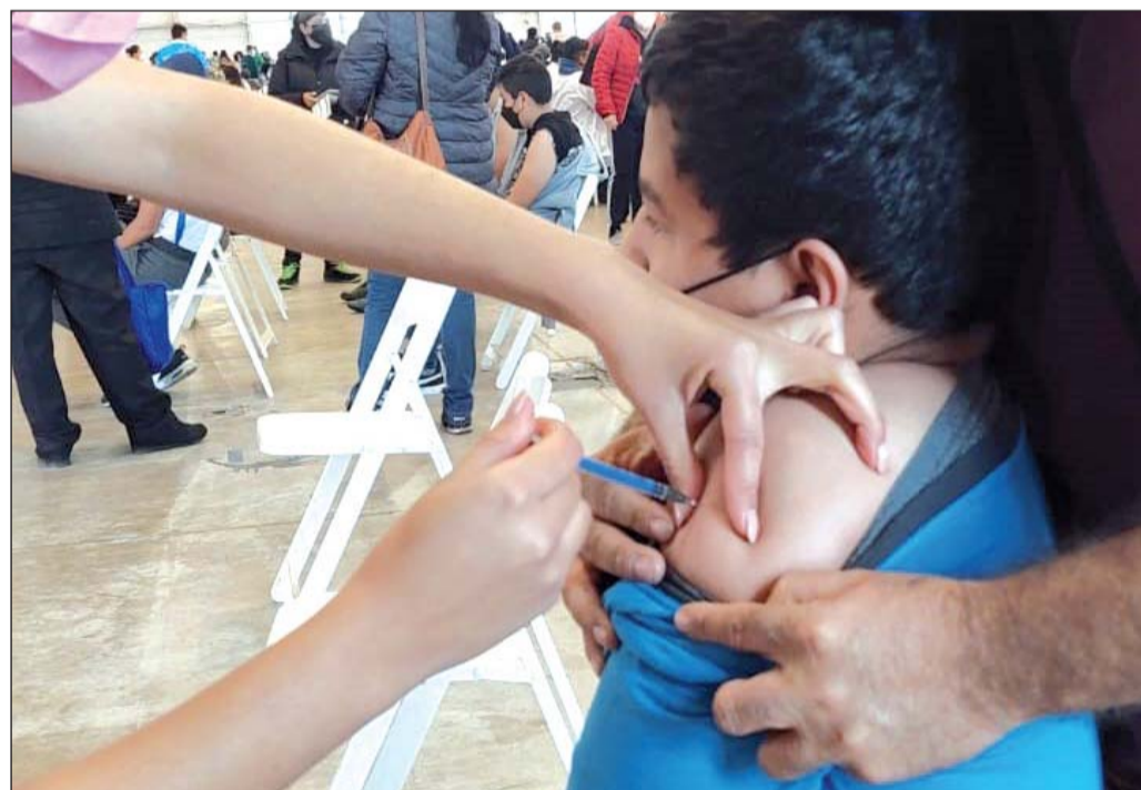
De los dos mil 300 menores de 12 a 14 años vacunados, solo dos han sufrido alguna reacción alérgica, pero no fueron casos graves.

Dijo que también habrá campaña de vacunación la el segundo refuerzo que será con Cansino porque ya no se cuenta con AstraZeneca.