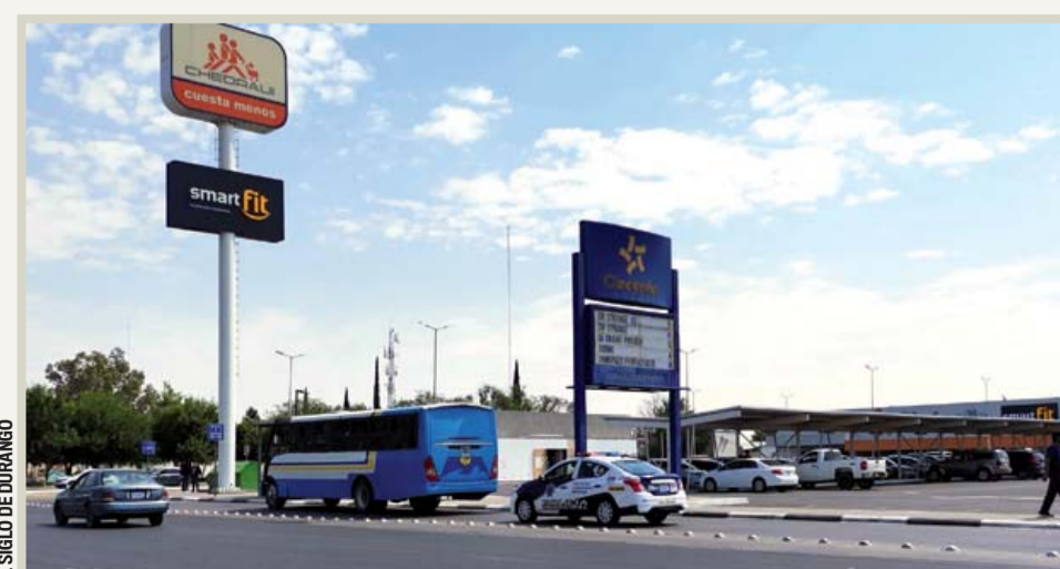
EL SIGLO DE DURANGO