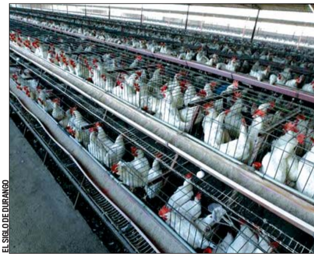
EL SIGLO DE DURANGO

la economía, para la alimentación de los duranguenses, de los coahuilenses, pero en general afecta al país porque mucho de lo que se produce en La Laguna no solo se vende en el mercado nacional sino internacional”, concluyó.