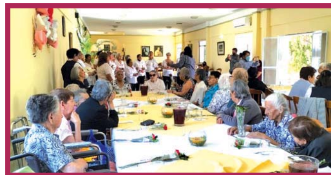
Se realizó una misa de acción de gracias.