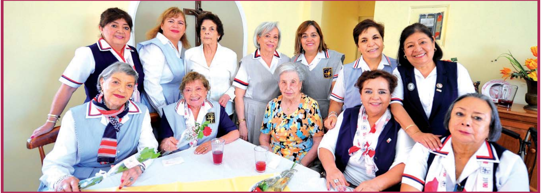
Gratos momentos se disfrutaron en este día.

Conmemoraron el Día de la Madre y también a Santa Luisa de Marillac.