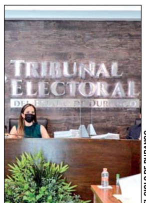
Juicios. En la sesión se resolvieron 12 juicios electorales y 13 juicios ciudadanos.

Al resolver el juicio electoral 33, se determinó revocar el registro de la candidata propietaria a la séptima regiduría por el ayuntamiento de Gómez Palacio, en la planilla postulada por la coalición “Juntos hacemos historia en Durango”, ya que la candidata en cuestión, no cumple con el requisito de elegibilidad que se exige a quien aspira contender bajo la figura de la reelección por partido distinto al postulante en la elección anterior, relativo a renunciar o perder la militancia en ese partido durante la primera mitad de su mandato.