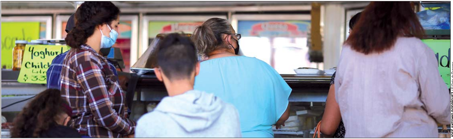
Panorama. No se vislumbra muy alentador, por lo que la entrevistada urgió a apostarle al tema agroalimentario.

“Si es preocupante esto de la gripe aviar, no nos esperábamos esto todavía aparte de la inflación. Es un tema que viene a hacer que con el asunto de la inflación todavía suba más, lo tenemos en 7.6, a lo mejor a finales del primer se-