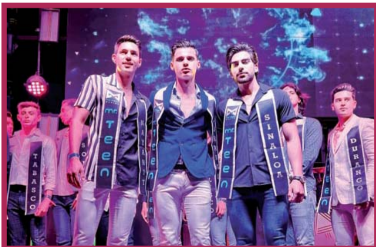
El top 3 de categoría Fotogenia, donde también figuró Durango.