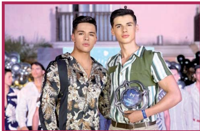
Aquí al momento de recibir premio al Mejor Traje Típico.