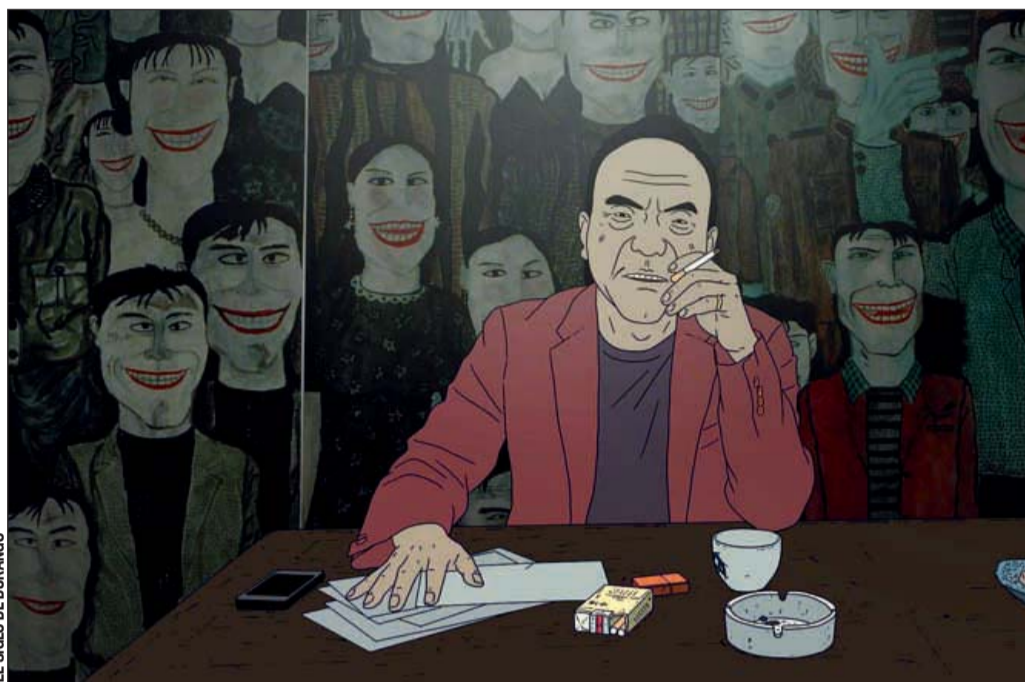
Proyecciones. Los cuatro trabajos exhibidos abordan diversas temáticas, desde drama hasta crímenes animados.

La programación en el CORE continúa este miércoles.