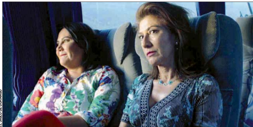
Trama. El filme muestra la vida de dos personas que luchan por encontrar su propio camino.

"Días de invierno" está inspirado en las propias vivencias del director, origi-