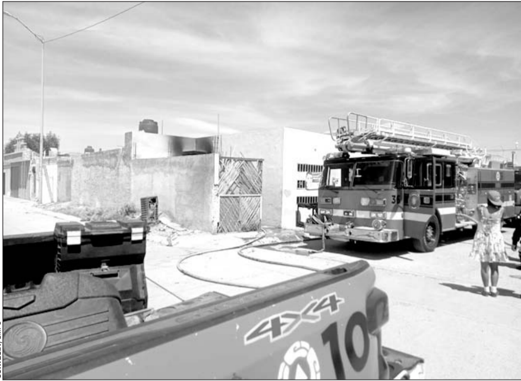
Actividad. Bomberos apagan incendio en una casa habitación en el Caminos del Sol.

Según vecinos de la casa siniestrada, en ella vive una persona del sexo femenino, quien padece de sus facultades mentales, razón por la cual no es la primera vez que la vivienda sufre incendio.